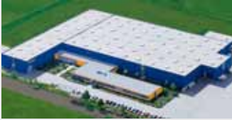
Hörmann KG Dissen, Deutschland