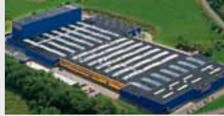
Hörmann KG Freisen, Deutschland