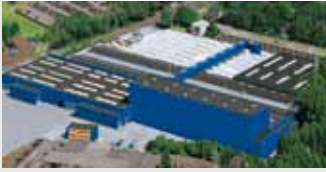
Hörmann KG Amshausen, Deutschland