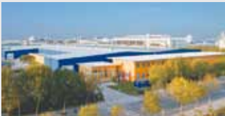
Hörmann Beijing, China