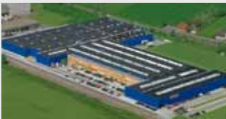
Hörmann KG Werne, Deutschland