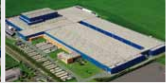
Hörmann KG Ichttershausen, Deutschland