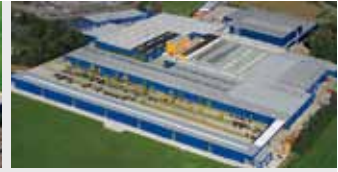
Hörmann KG Brockhagen, Deutschland