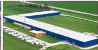
Hörmann Legnica Sp. z o.o., Polen