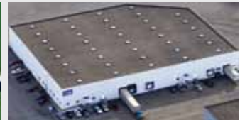
Hörmann Flexon, Leetsdale PA, USA

Als einziger Hersteller auf dem internationalen Markt bietet die Hörmann Gruppe alle wichtigen Bauelemente aus einer Hand. Sie werden in hochspezialisierten Werken nach dem neuesten Stand der Technik gefertigt. Durch das flächendeckende Vertriebs- und Servicenetz in Europa und die Präsenz in Amerika und China ist Hörmann Ihr starker, internationaler Partner für hochwertige Bauelemente. In einer Qualität ohne Kompromisse.