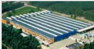
Hörmann Genk NV, Belgien