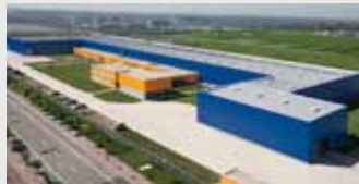
Hörmann Tianjin, China