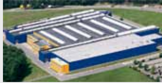
Hörmann KG Eckelhausen, Deutschland