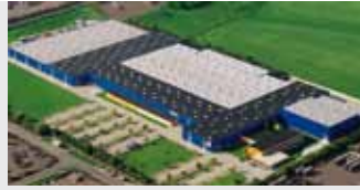
Hörmann KG Brandis, Deutschland