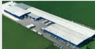
Hörmann LLC, Montgomery IL, USA